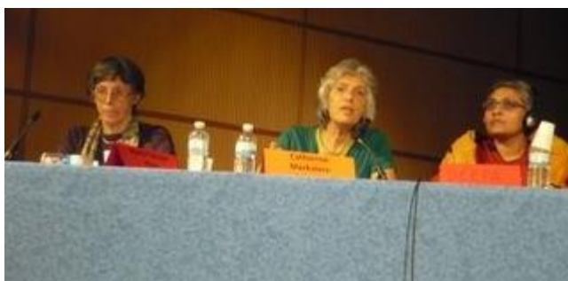
Presentació a la trobada 2011 a Brussel·les del Rifs Xarxa internacional de dones i salut